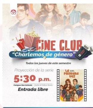
Ilustración 3. Promoción de actividades de bienestar