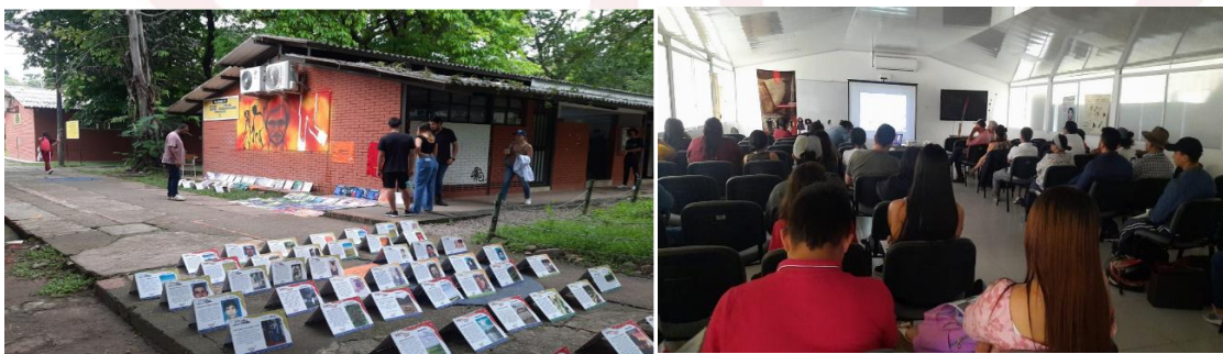
Ilustración 1 . Conmemoración día de las víctimas