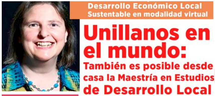
Ilustración 4. Curso de Desarrollo Económico Local Sustentable

El hecho de contar con docentes de talla internacional, permite el fortalecimiento de la internacionalización del currículo en la Universidad de los Llanos, a través de la cooperación académica internacional. De esta manera, entendiendo que la internacionalización no es un fin en sí mismo, sino un medio para el cumplimiento de los objetivos institucionales, se da contribuye al cumplimiento de la misión institucional de “ Formar ciudadanos con sensibilidad y aprecio por el patrimonio histórico, social, cultural y ecológico de la humanidad, competentes y comprometidos en la solución de problemas de la Orinoquía y del país, con visión universal, conservando la naturaleza como centro de generación, preservación, transmisión y difusión del conocimiento y la cultura ”.