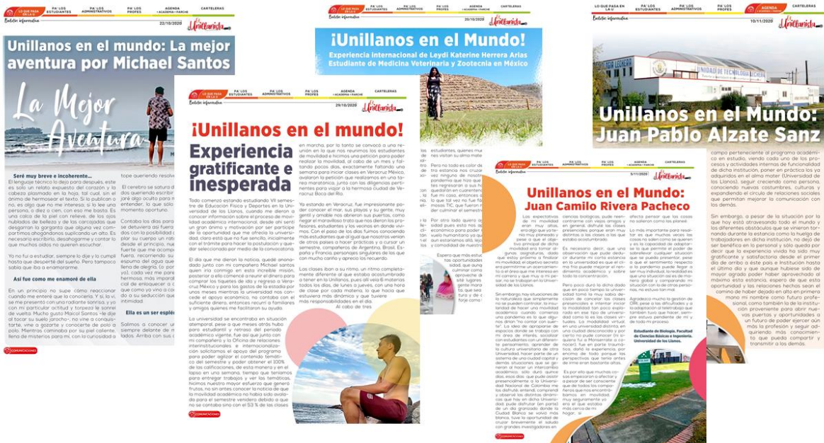
Ilustración 1. Artículos de algunos estudiantes que realizaron movilidad académica durante 2020, publicados en el Boletín Unillanista

Cabe mencionar que estos estudiantes realizaron su movilidad a nivel internacional en el primer semestre del año y tres estudiantes pudieron continuar con una segunda movilidad en el segundo semestre del año, ellos son dos estudiantes de Medicina Veterinaria y zootecnia que se encuentran en España y un estudiante de Ingeniería electrónica que realizó su segunda movilidad en Argentina.