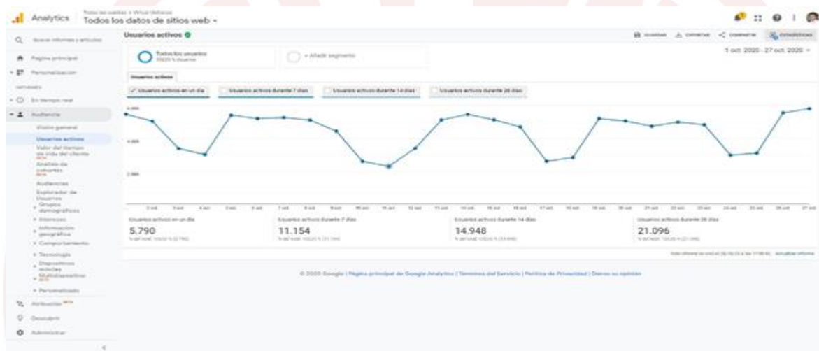
Ilustración 7. Estadísticas de conexión a la plataforma

La anterior gráfica muestra las estadísticas de conexión, la cual muestra que está experimentando un total de 5.790 usuarios activos durante un día, valores que varían durante el presente periodo académico, obteniendo como datos mínimos de acceso 2.298 usuarios activos.