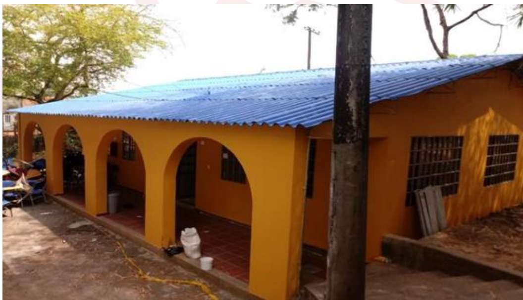
Ilustración 12. Adecuaciones de las aulas San Antonio

Se realizaron las adecuaciones de las aulas No. 7, 6, 5, 4, 3, y 2 del campus San Antonio, con el fin de mejorar el confort a la comunidad universitaria. Estas adecuaciones incluyeron cambio de cielo raso, pintura e iluminación.