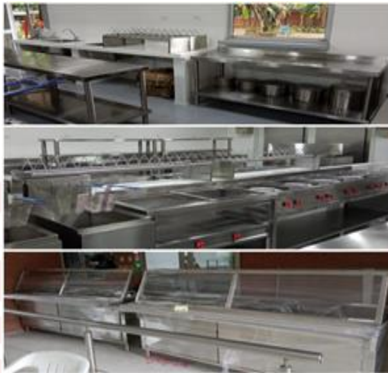
Ilustración 15. Dotación comedor universitario