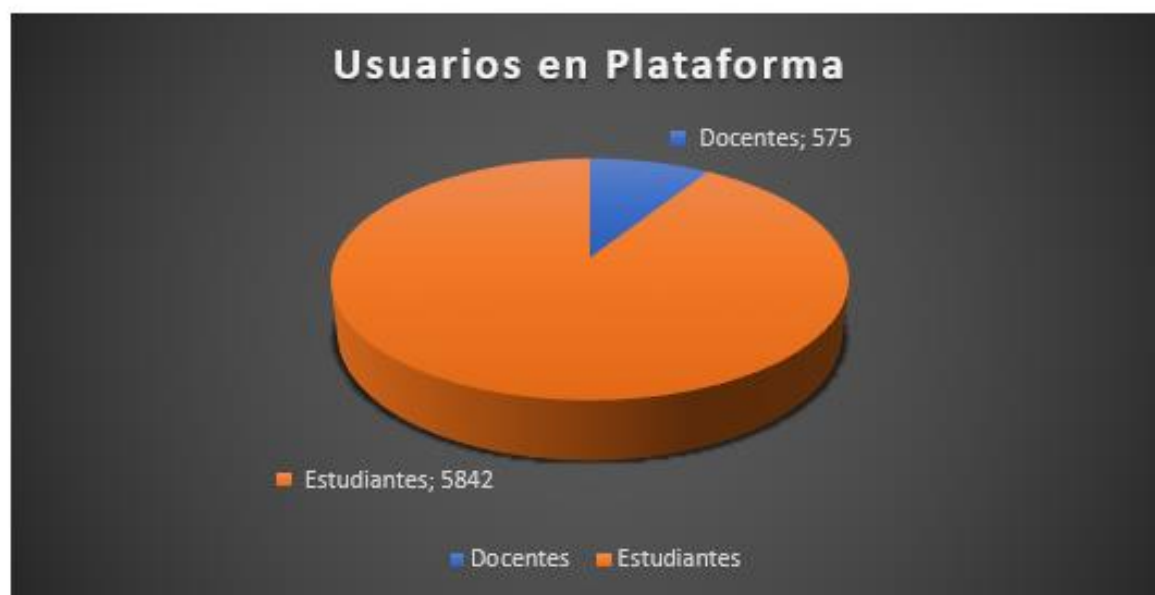
Ilustración 6. Usuarios en plataforma virtual

Durante la presente vigencia se han realizado múltiples esfuerzos para que los profesores y alumnos utilicen la Plataforma Moodle como herramienta de mediación para el desarrollo de las labores de enseñanza y aprendizaje, logrando avanzar tanto en el uso como en la actualización de contenidos. Igualmente se ha trabajado en la consolidación de los espacios en lo relacionado con el componente gráfico y organizativo de la información, lo cual ha permitido motivar su implementación, tal como se demuestra en las estadísticas siguientes.