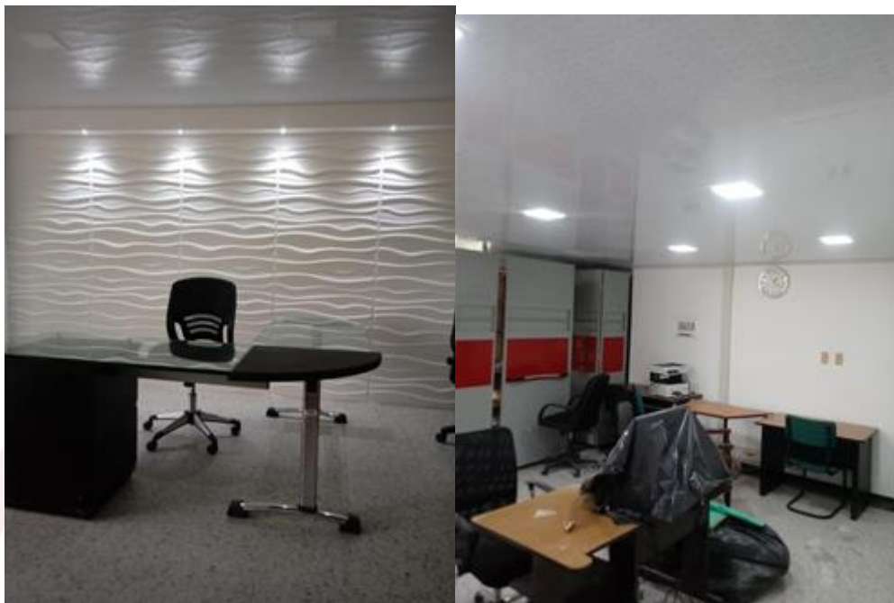
Ilustración 11. Adecuaciones Decanatura de la Facultad de Ciencias Básicas e Ingeniería

Se realizaron las adecuaciones de las aulas No. 7, 6, 5, 4, 3, y 2 del campus San Antonio, con el fin de mejorar el confort a la comunidad universitaria. Estas adecuaciones incluyeron cambio de cielo raso, pintura e iluminación.