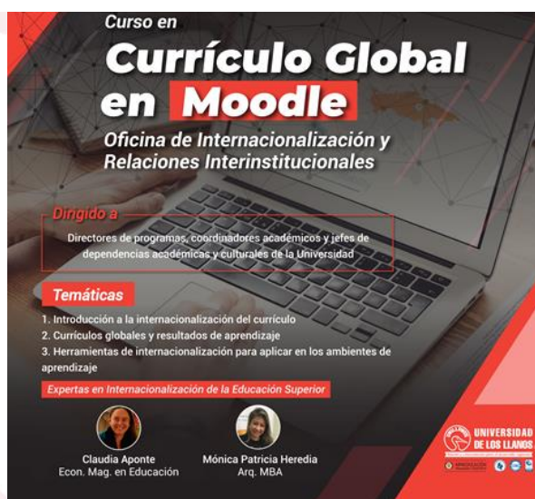
Ilustración 3. Curso de Currículo global en Moodle de Unillanos

Línea de acción: Visión universal de la ciencia y la tecnología para una Universidad Investigativa.