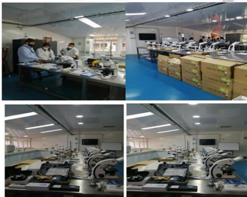
Ilustración 10. Dotación de laboratorios