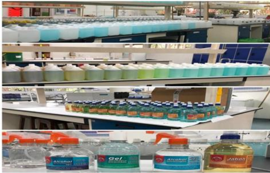
Ilustración 16. Elaboración propia de productos farmacéuticos para su uso como elementos de Bioseguridad