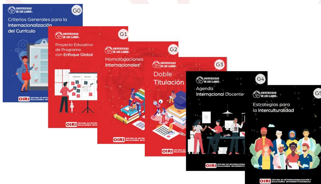
Ilustración 2.. Guías de internacionalización del currículo publicadas en el micrositio de OIRI

En el año 2020, para el fortalecimiento de la internacionalización de los currículos y de los programas académicos, se ha venido trabajando en dos actividades. La primera fue el diseño y elaboración de unas guías prácticas sobre la internacionalización del currículo, gestión de la internacionalización e internacionalización en casa.