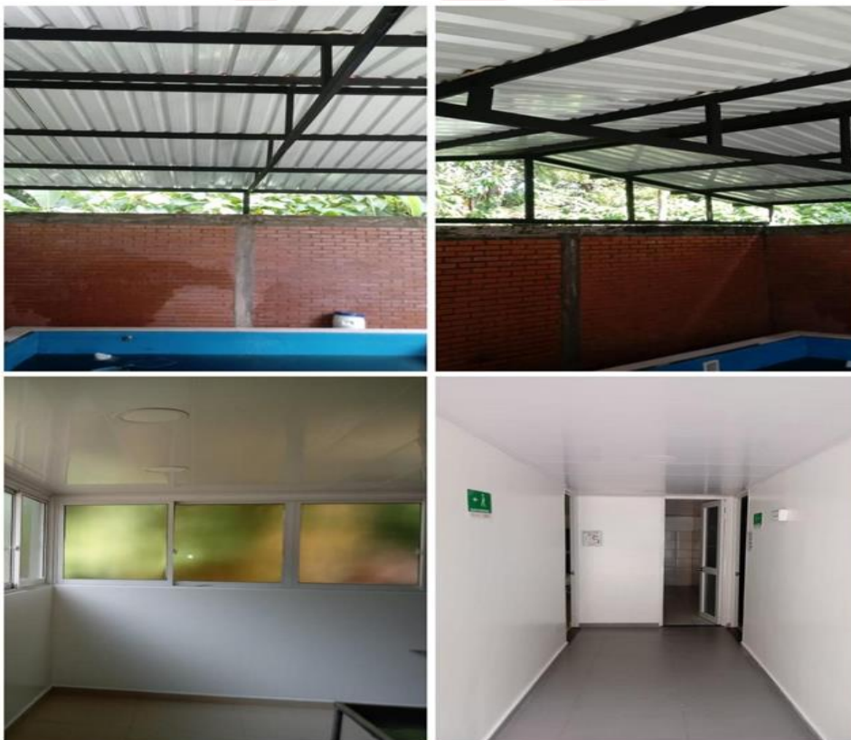
Ilustración 13. Adecuaciones Clínica Veterinaria

En la Clínica Veterinaria sede Barcelona, se está realizando el mejoramiento del área de Hospitalización, en donde se instaló una cubierta para mejorar las condiciones de la piscina la cual se utiliza para la rehabilitación de animales de pequeñas especies, y adicionalmente se está realizando la adecuación del cielo raso de los quirófanos. El estado de la obra es de 90%.