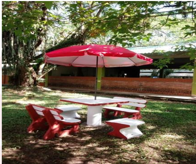
Ilustración 14. Mesas para el bienestar de la comunidad universitaria

Se instalaron 13 juegos de mesas en concreto con sus respectivas sillas y sombrillas, que están destinada al bienestar de la comunidad universitaria en el campus Barcelona.