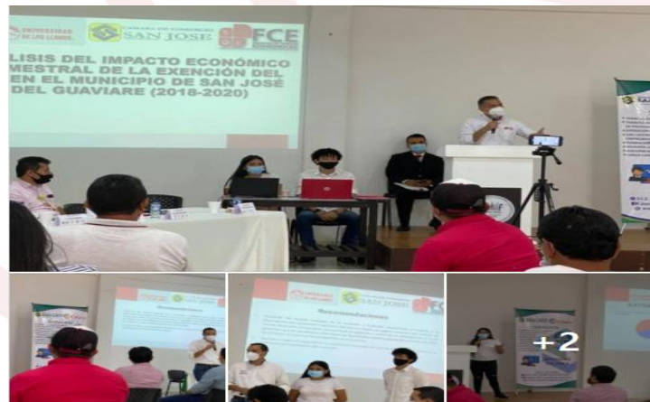
Ilustración 9. Presencia en el Departamento del Guaviare