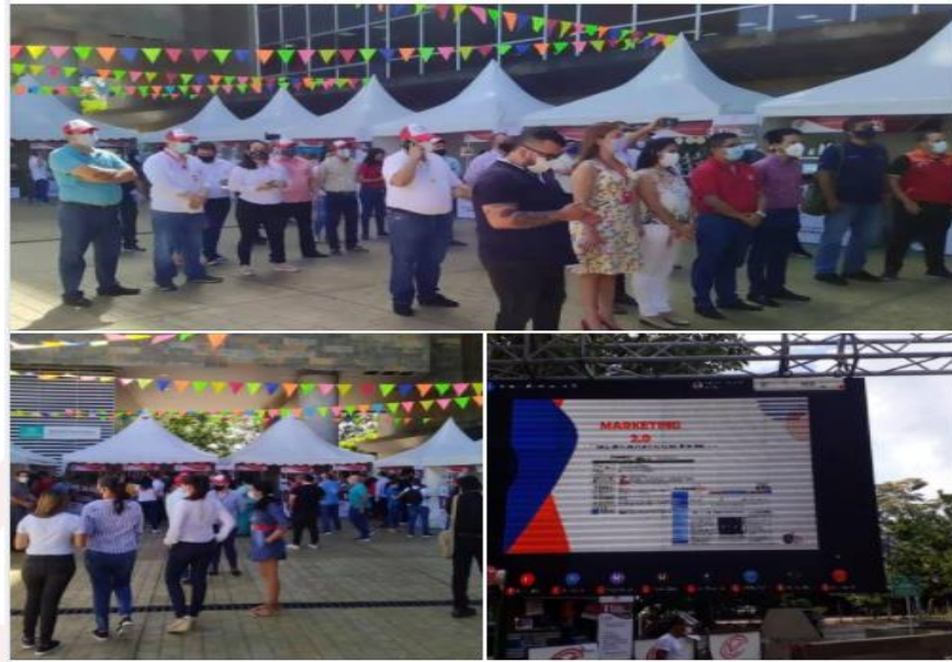
Ilustración 8. Feria empresarial multisectorial