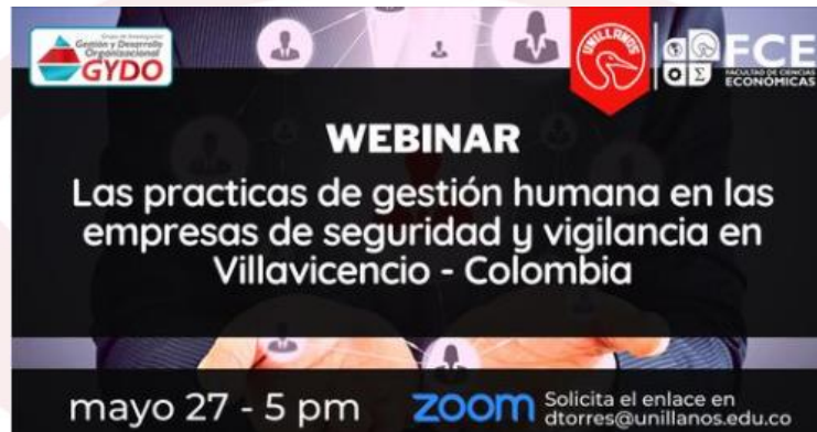
Ilustración 7. Webinar con la Red Gestio