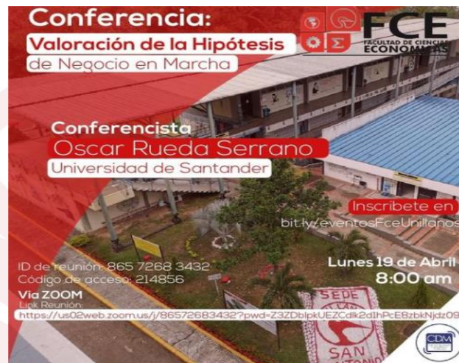
Ilustración 5. conferencia valor de la hipotesis