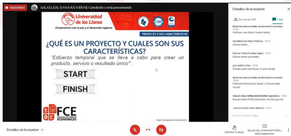
Ilustración 4. Conversatorio riesgos en los proyectos