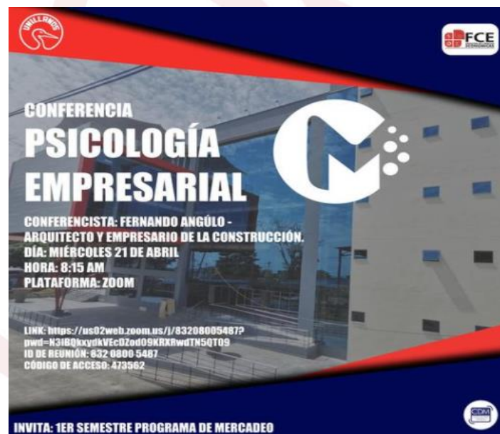
Ilustración 2. Conferencia psicología empresarial