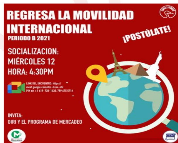
Ilustración 6. Socialización movilidad internacional