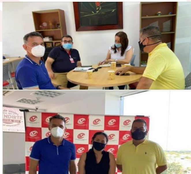
Ilustración 10. Formalizacion convenio Camara de Comercio de Villavicencio