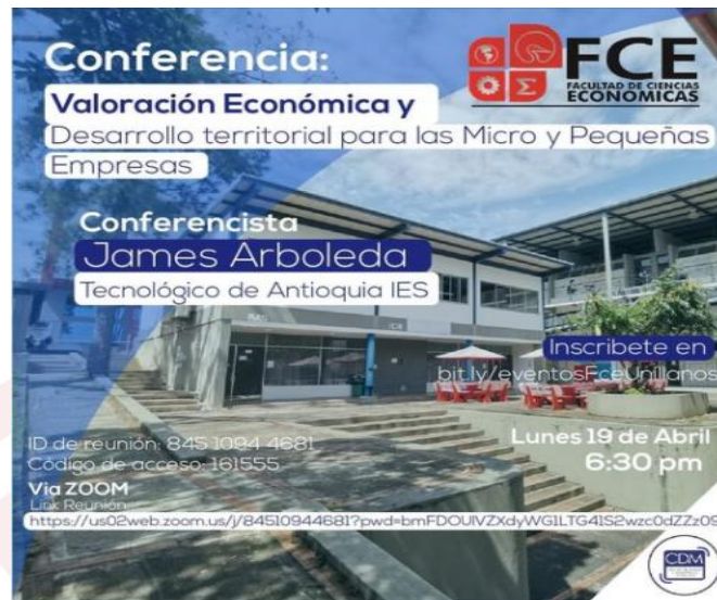
Ilustración 1. Conferencia valoración económica