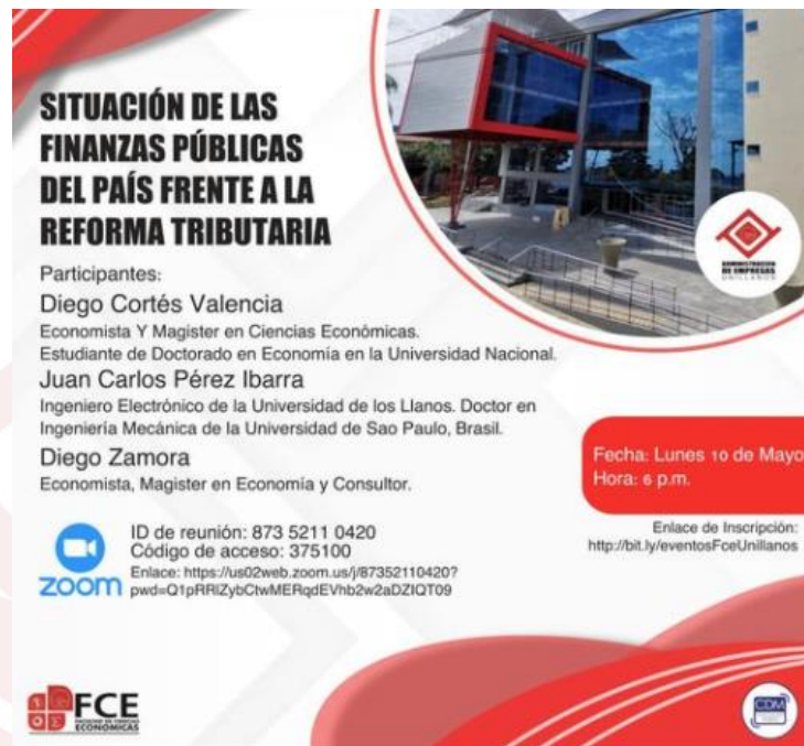
Ilustración 3. Conferencia situación de las finanzas publicas del pais frente a la reforma tributaria